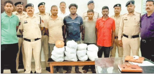
पुलिस गिरफ्त में गांजा तस्कर एवं जब्त गांजे की खेप।