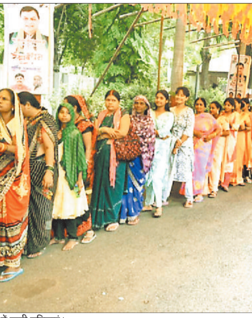
अपनी बारी का इंतजार करती कतार में खड़ी महिलाएं।