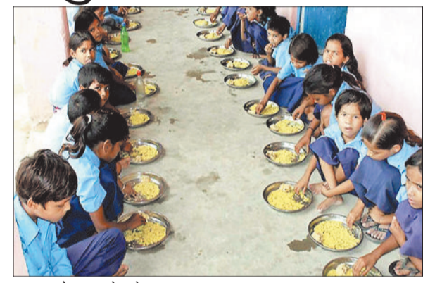
मध्याह्न भोजन करते बच्चे।

शासकीय स्कूलों में बच्चों को दिये जाने वाले नाश्ता और मध्याह्न भोजन की गुणवत्ता जांचने के लिए शिक्षा एवं खाद्य एवं औषधी विभाग