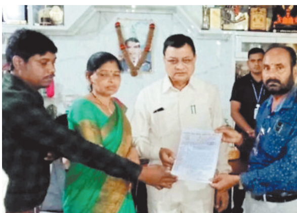
उद्योग मंत्री को ज्ञापन सौंपते हुए।