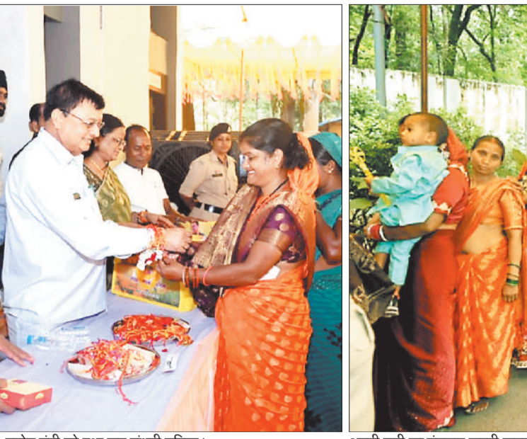
अपनी बारी का इंतजार करती कतार में खड़ी महिलाएं।